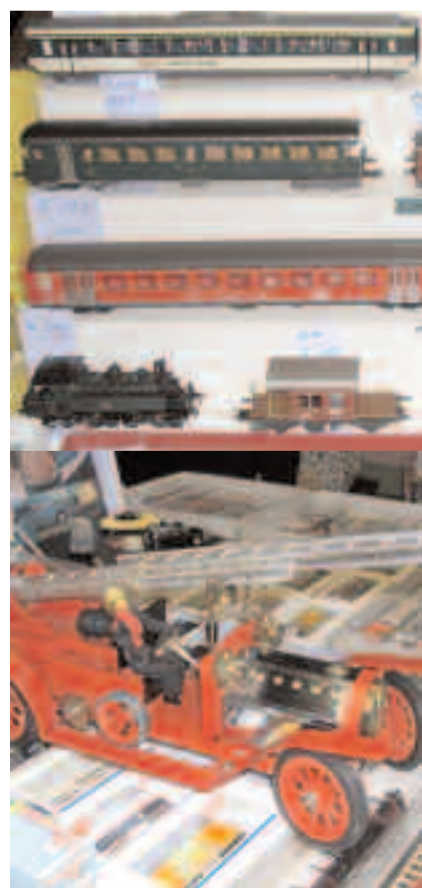
Kaum ein Spielzeug, ein Auto oder eine Bahn, die es an der Börse nicht gibt.